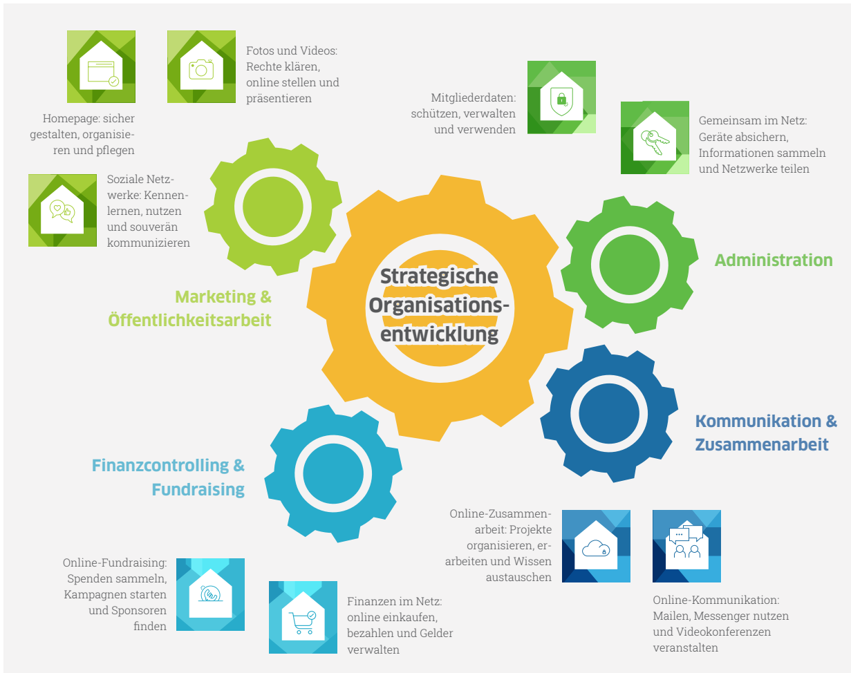
Strategische Organisationsentwicklung: mögliche Handlungsfelder und Arbeitsvorgänge mit den Handbüchern der Digitalen Nachbarschaft ► www.digitale-nachbarschaft.de/materialbestellung

Um Antworten auf die folgenden Fragen in Deinem Verein zu finden und diese zu diskutieren, lohnt es sich, zu internen Workshops einzuladen. Alternativ oder ergänzend können diese auch digital mithilfe von Kollaborationstools zusammengetragen werden. Hinweise dazu findest Du im DiNa-Handbuch „Online-Zusammenarbeit: Projekte organisieren, erarbeiten und Wissen austauschen“.