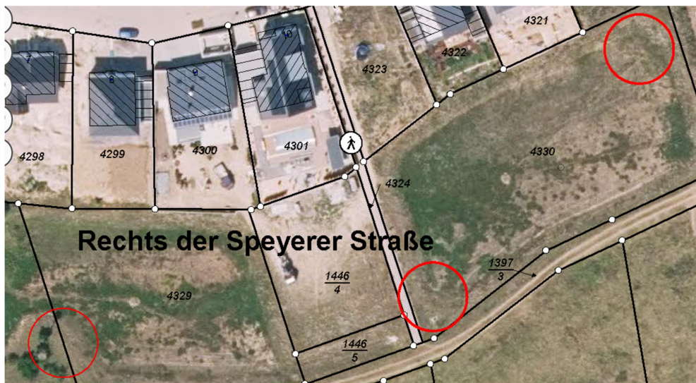
Regenrückhaltebecken südlich vom Neubaugebiet